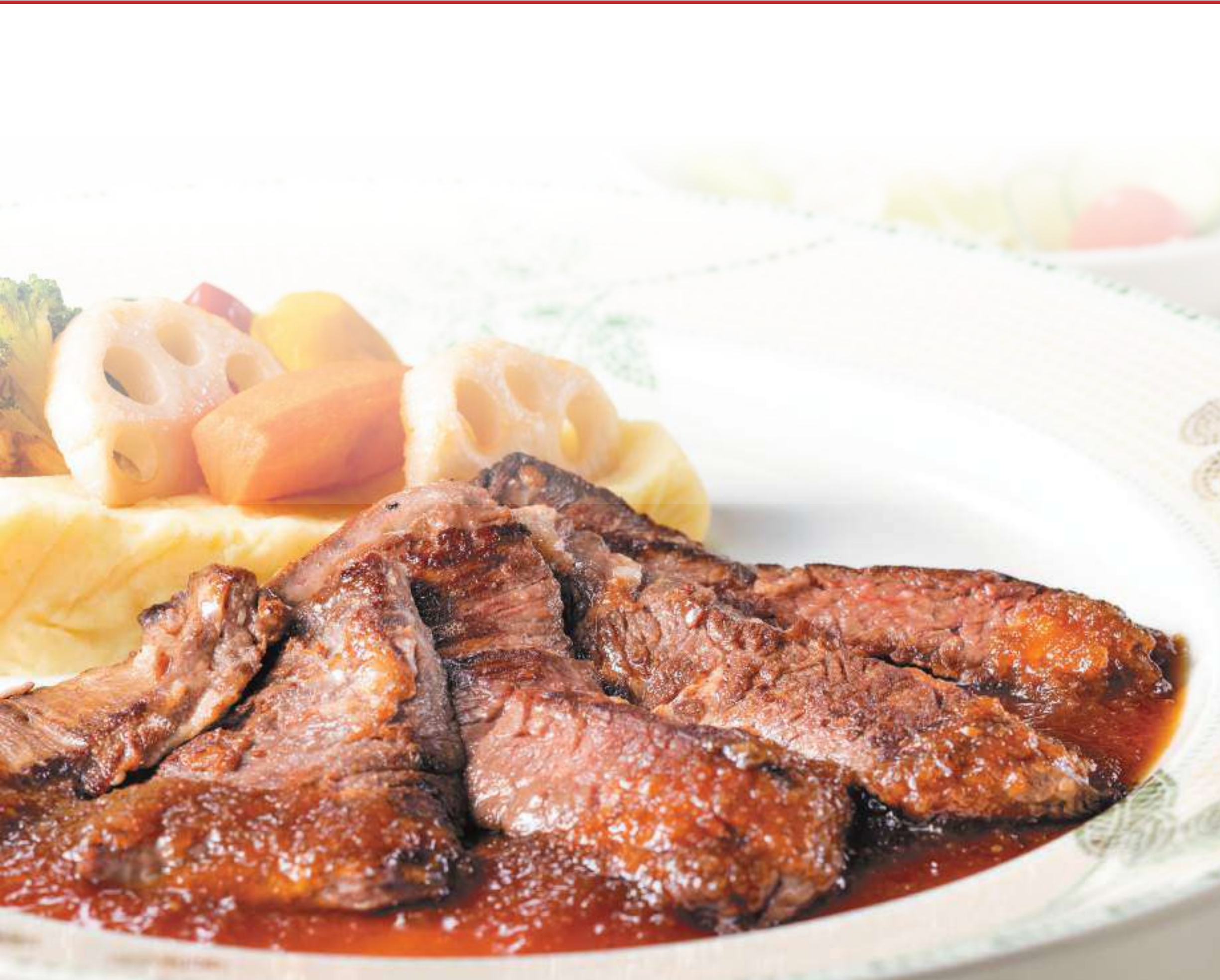
ハラミステーキ Skirt steak ¥2,600 (税込 tax included)

ハンバーグステーキ Hamburger steak 200g ¥2,600 (税込 tax included)