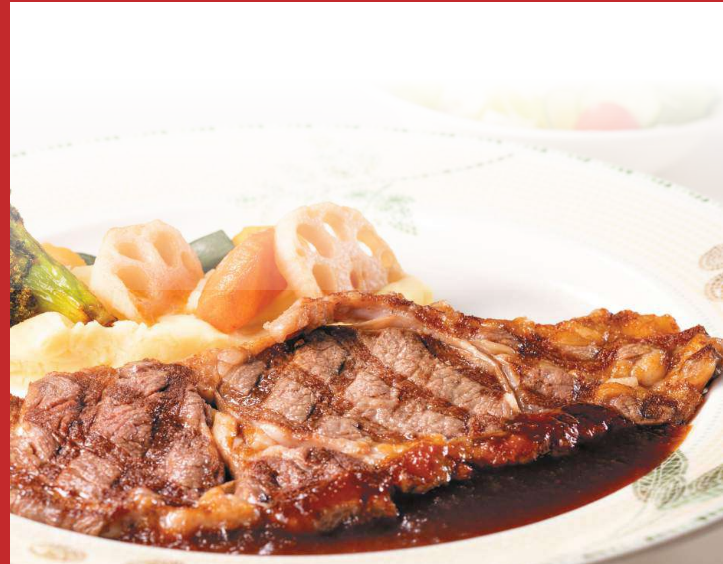
リブローズステーキ Rib eye steak 200g ¥4,300 (税込 tax included)