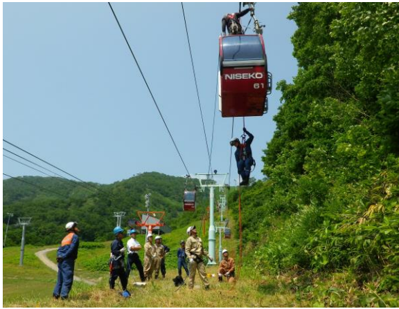
【夏季消防署と合同救助訓練】