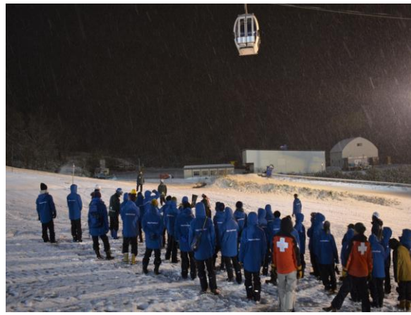
【冬季消防署と合同救助訓練】