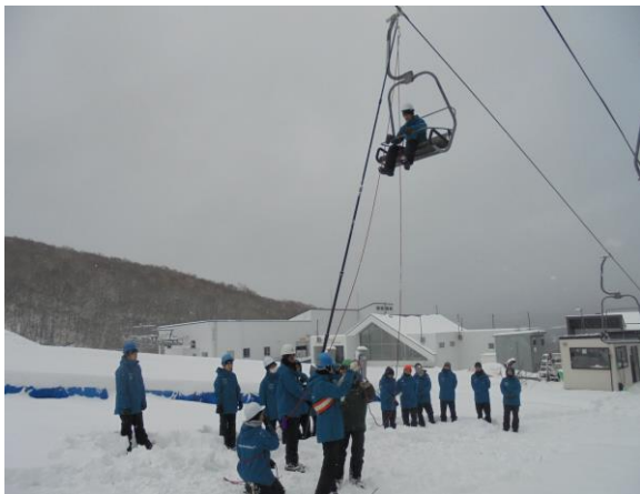
【冬季 勤務前救助訓練】