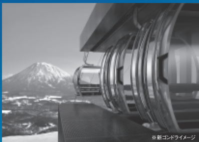
※新ゴンドライメージ