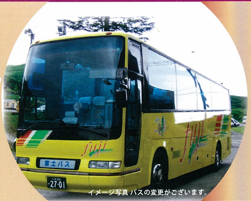
イメージ写真 バスの変更がございます。